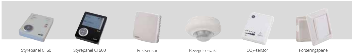
Styrepanel CI 60